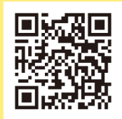
とくしま産業振興機構 セミナーページ