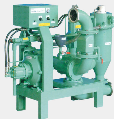
立型ポリユートポンプ 小魚移送ポンプ 油圧式船上型